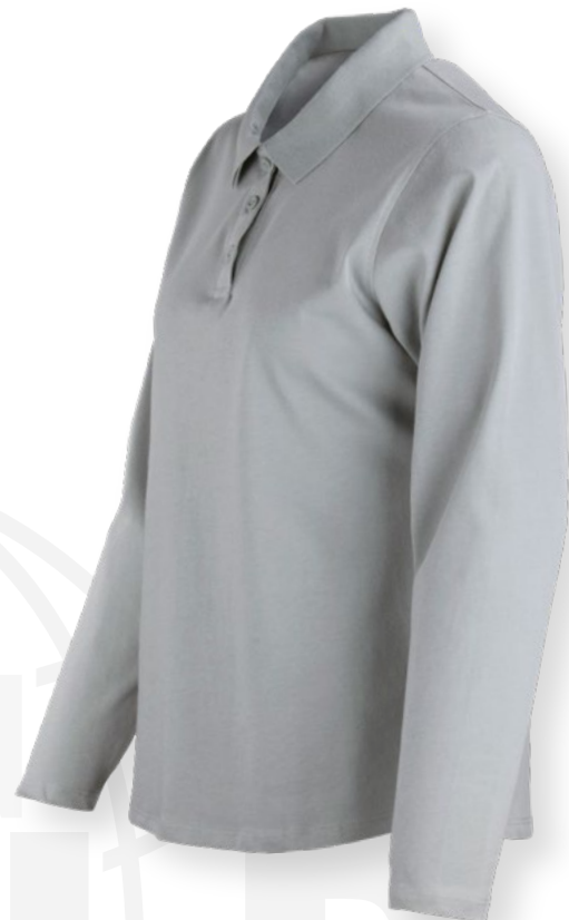
TABLA DE TALLAS